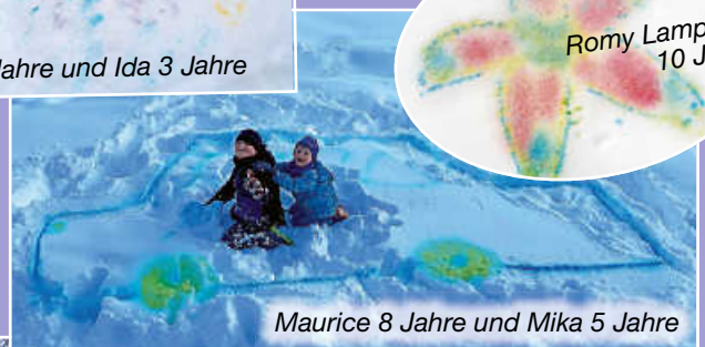
Maurice 8 Jahre und Mika 5 Jahre