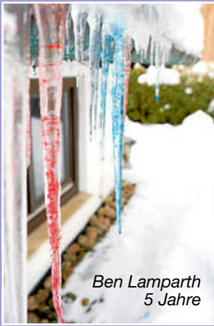
Ben Lamparth 5 Jahre