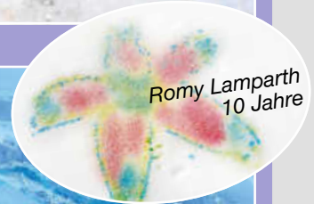
Romy Lamparth 10 Jahre