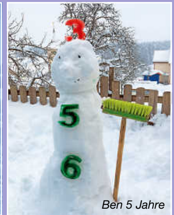
Ben 5 Jahre