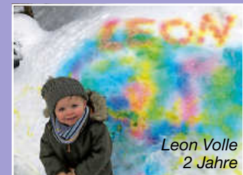
Leon Volle 2 Jahre