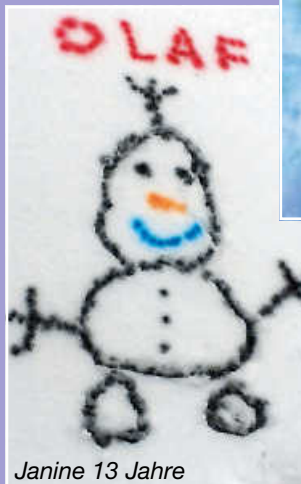
Janine 13 Jahre