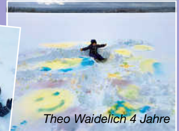
Theo Waidelich 4 Jahre