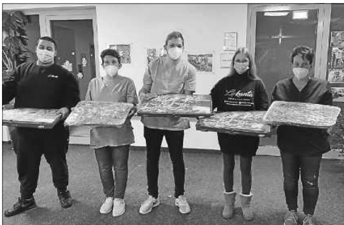
„Pizza für alle“ hieß es im Wohn-Pflegeheim „Haus Tannenburg“.

in verschiedenen Geschäftsfeldern das gemeinsame Ziel einer optimalen Förderung und Versorgung von Menschen mit Behinderung und vergleichbarem Hilfebedarf als Beitrag zum gesellschaftlichen Inklusionsprozess. Mehr Infos unter www.johannes-diakonie.de