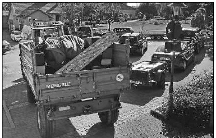
Eltern helfen beim Umzug

Weitere Bilder der Kita auf der nächsten Seite