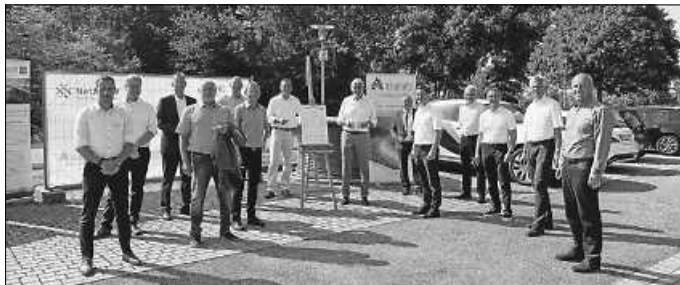
Symbolische Unterzeichnung des Generalunternehmer-Vertrags im Dorzentrum Bad Liebenzell Monakam.