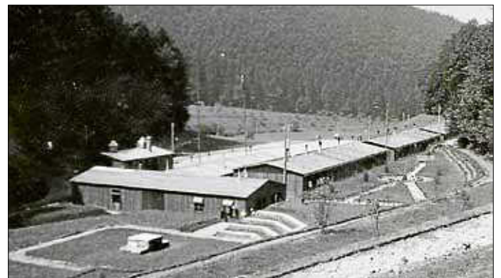
Das Lager umfasste drei Baracken, ein Verwaltungsgebäude, eine Baracke mit Küche und Speisesaal sowie eine Waschbaracke.