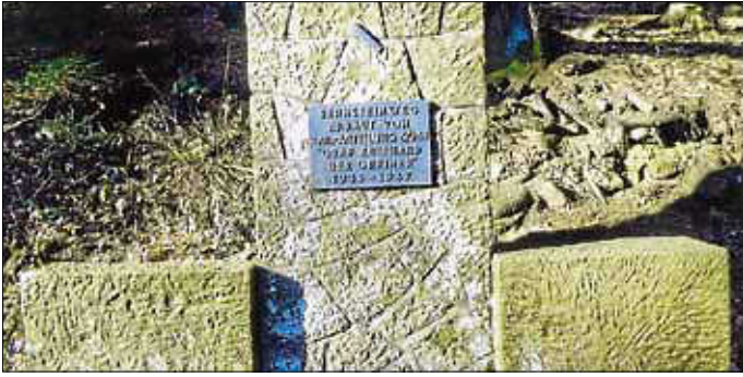
Gedenktafel am Bernsteinweg.