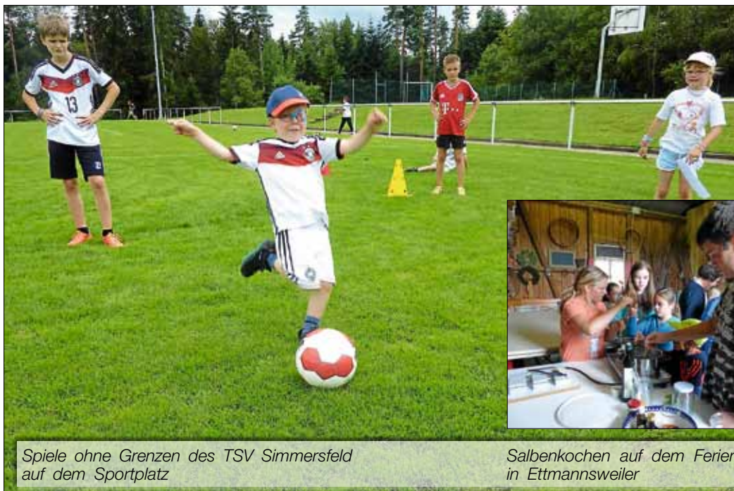
Spiele ohne Grenzen des TSV Simmersfeld auf dem Sportplatz