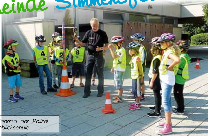
Übungsfahren mit dem Fahrrad der Polizei auf dem Schulhof der Albblickschule