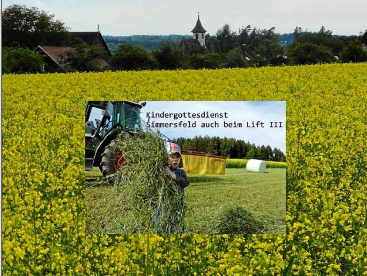
Kindergottesdienst Simmersfeld auch beim Lift III

Sonntag, 1. Juni Erntebittgottesdienst 10 Uhr in der Scheune beim Lift III in Simmersfeld mit Pfarrer Alexander Schweizer und dem Posaunenchor